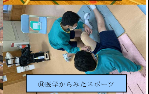
⑭医学からみたスポーツ