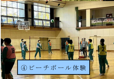
④ビーチボール体験