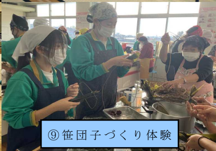
⑨笹団子づくり体験