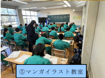
⑤マンガイラスト教室