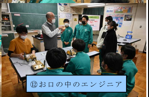
⑫お口の中のエンジニア