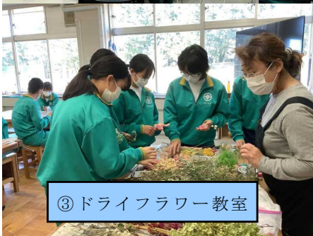
③ドライフラワー教室